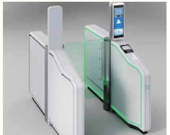
Boarding gate omologato in Cina.