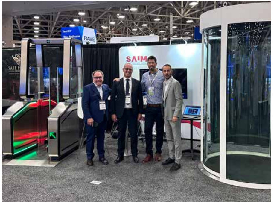
Nella foto il team di Saima Sicurezza e Saima North America a Dallas.

Nello stand, sempre affollatissimo un pool di esperti, italiani, americani e canadesi per presentare al meglio la gamma di produzione e supportare clienti nuovi e "vecchi" verso la scelta migliore, secondo le rispettive richieste