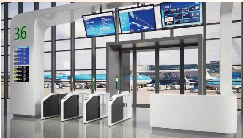
I nostri varchi installati in Cina.

Siamo pronti, quindi per le opportunità che, oggi più che mai, la Cina potrebbe offrirci. La collaborazione con China 2000 è lo step che aspettavamo per poterci definitivamente radicare anche in quel segmento di mercato».